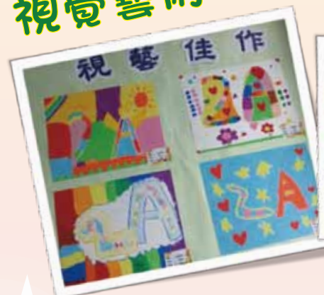
各班視藝佳作展示