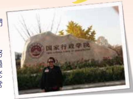
伍校長到北京進修留影