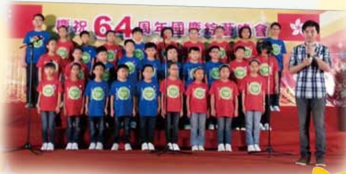
歌詠團在海心公園參加「國慶綜藝晚會」表演

除了學業及運動，本校亦注重培育學生在不同藝術範疇的興趣及能力，例如歌詠、敲擊樂、水墨畫、視覺藝術等等。