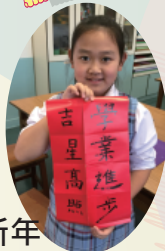
四、五年級的同學已練得一手好字