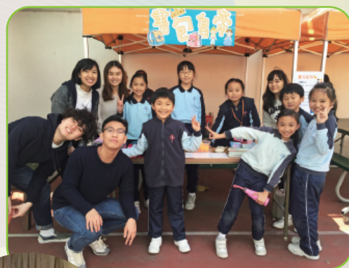
「書包皇帝」攤位遊戲