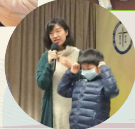
理工大學姐姐及「健康兵團」教大家如何正確佩戴口罩