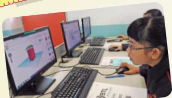
培養學生對立體的認識