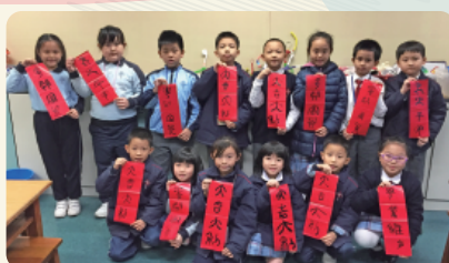
書法班(初班)同學於農曆新年時齊齊寫揮春賀新年