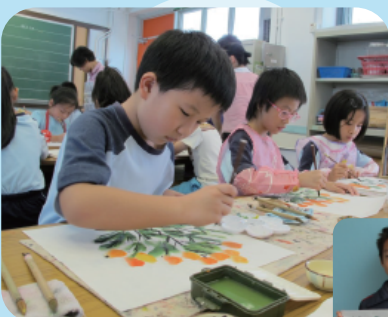
水墨畫上課情況 及學生作品