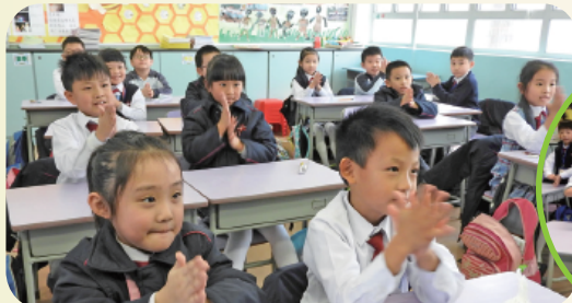
「健康兵團」帶領同學一起學洗手

本校參加香港理工大學護理學院主辦的健康兵團夥伴計劃「身心健康在校園」，建立健康校園文化，推廣健康意識。