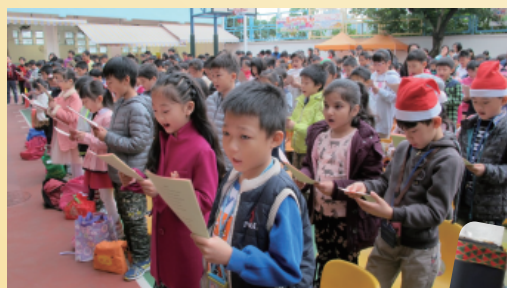
同學們唱著詩歌歡度聖誕！

聖誕節是普天同慶的日子，本校於12月22日舉行聖誕聯歡會。當天，除聖誕崇拜外，還有學生表演、全校大抽獎及各班慶祝會，校園充滿了歡愉的氣氛。