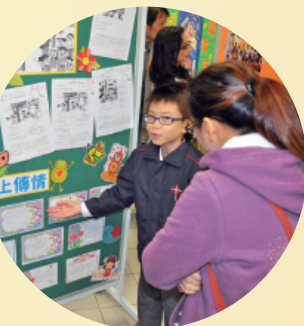
家長到展覽區參觀