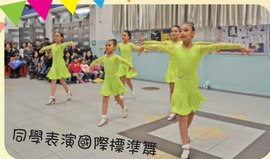
同學表演國際標準舞

2015年12月5日舉行「九龍城34網四校聯合親子訪校活動」。當日學校安排了豐富的節目，包括學生表演、學生習作展覽，以及課堂活動，藉此加深家長和幼稚園學生對學校的認識。